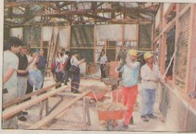
↑參加座談會人員參訪新東國小木造辦公室修復工程。