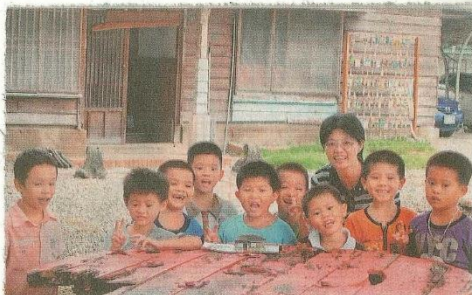
偏遠小校新東國小致力推動傳統建物保存，老建物紙模型創作受到歡迎，校方計畫將相關活動納入全校課程推廣。