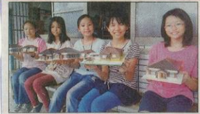
↑新東國小應屆畢業生把母校歷史建築模型當畢業禮物帶回家。