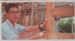
新東國小木造辦公室拆解外觀，著手修繕、補強木造結構。