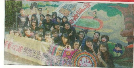
「完成守護老房子彩繪作」屆後，正修科大學生在東東國小校園內合影留念。 (記者翁聖攝)