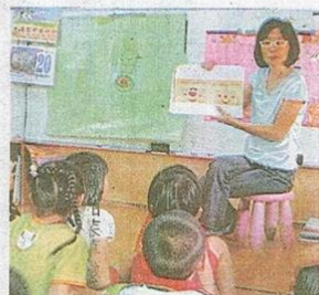
▲小朋友專心聆聽教師講述〈誰來敲門〉繪本故事。

日式建築物最特別的是房舍旁的「緣側（外廊）」，可以坐在這裡看風景、談天。王正斌像專家似的分析，抬高的地基，屋內的通氣孔及木頭、竹編夾泥牆等，可以說是棟環保的綠建築。